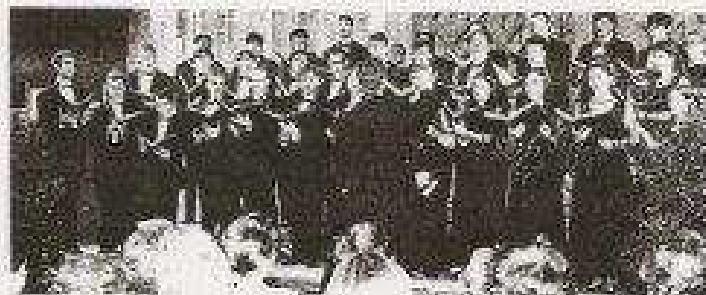
Le Chœur universitaire de Lehigh est formé d'une quarantaine de choristes

La Collégiale Saint-Vulfran a récemment accueilli un ensemble vocal aussi original. Formé d'une quarantaine de choristes, le Chœur Universitaire de Lehigh (Etat-Unis) développe une originalité et une densité lyrique hors du commun. L'un des points les plus remarquables, outre l'usage du métal et du verre par les chanteurs, est la volonté de faire ressortir au public des sonorités nouvelles. Samedi dernier, face à une centaine de personnes, le chœur américain a récité un vit sicché. Et pour cause. Le qualité de cet événement n'est plus à démontrer tant au niveau du choix des œuvres qui conduit le mélomane des Etats-Unis à l'Europe avec des auteurs comme Gótzke, Ligeti ou encore Berossini, qu'au niveau de l'interprétation. Ce grand chœur est dirigé par Steven Sametz, professeur et directeur des activités