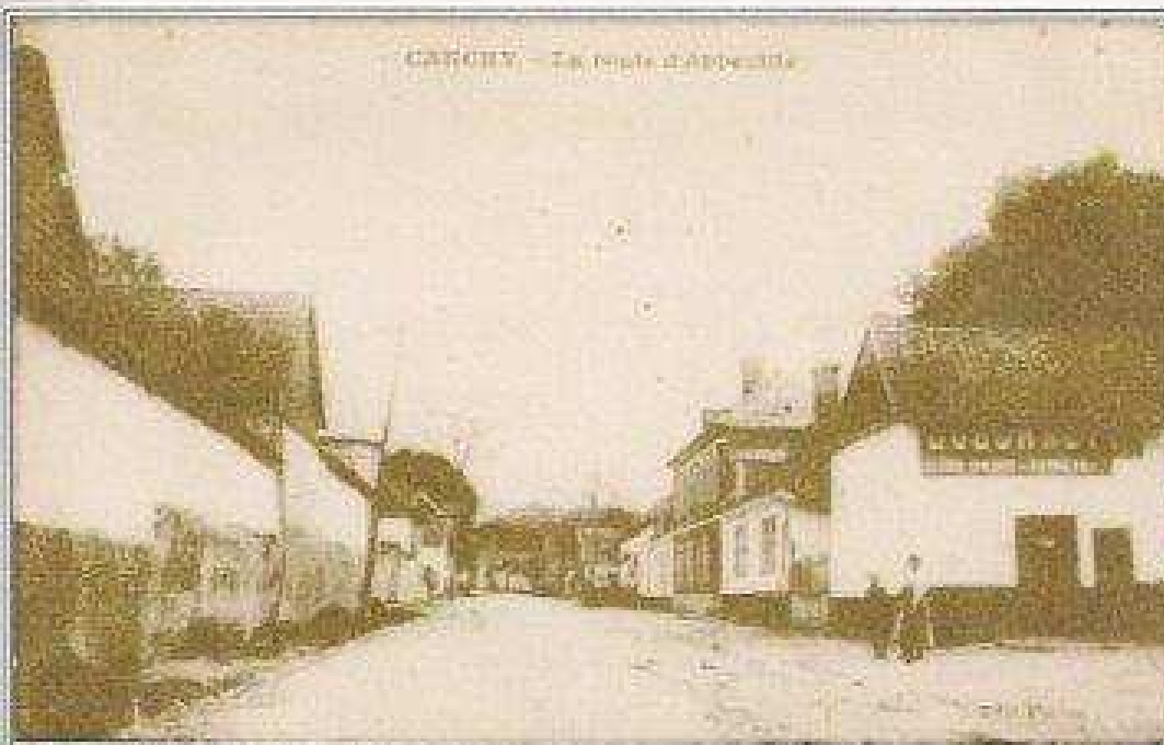
CANCHY — La route d'Abbeville

CANCHY La route d' Abbeville sur la droite l' Etude de Mtre LECUYER