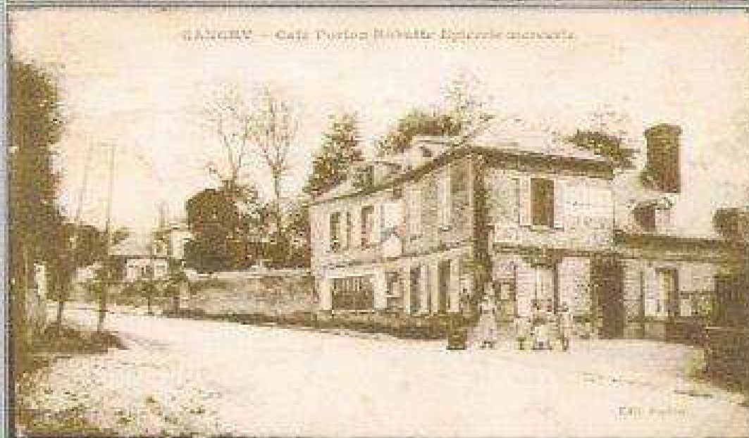
CANCHY — Café Porion Robutte Epicerie mercerie

CANCHY Café Porion- Robutte Epicerie-mercerie en face de l' Ecole