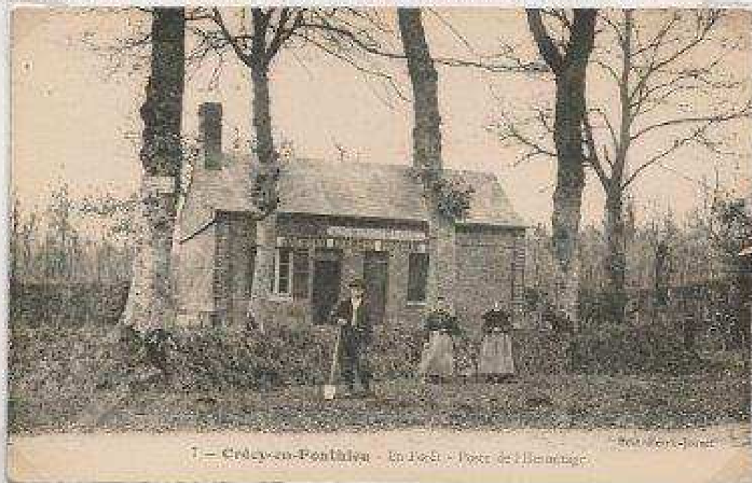
T - Crécy-en-Ponthieu - Le Bois - Forêt de l'Abbaye

Pour nous en tenir à la forêt de Crécy, celle-ci était royale depuis le 7 ème siècle (et peut être avant); les comtes de Ponthieu en avait l'usufruit. Elle devint domaniale à l'époque de la Révolution.