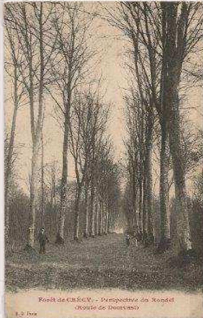
Forêt de CRÉCY, - Perspective de l'entrée (Comité de Douvres)

Parmi les sergents, on distinguait : le sergent à garde [ dont les tâches sont reprises ci-dessus ] le sergent forestier, plus une profession qu'un grade, pouvait être un membre de l'aristocratie locale, se rangeant au-dessus des sergents, le sergent « dangereux », le sergent traversier, appelé aussi sergent chevaucheur, tournant, volant, [ fiéffé ou non fiéffé ], peu apprécié de ses collègues, car circulant à cheval, il pouvait tomber à l'improviste sur le délinquant, le garennier, le perquier, le loupelier, souvent, un professionnel ayant prêté serment. L'année 1669 verra disparaître des structures surannées.